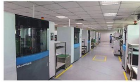
High-speed flying probe machine