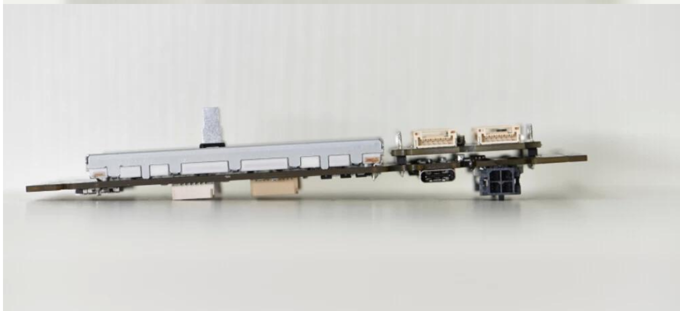
Агрегат РСВ печатной платы, высокое качество рсв Пзготовителей