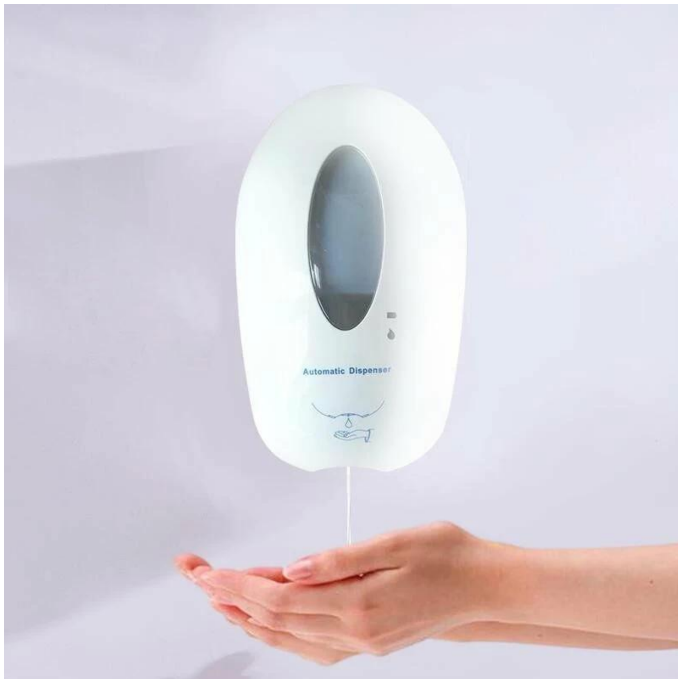
Dispenser di sapone in schiuma con supporto touchless