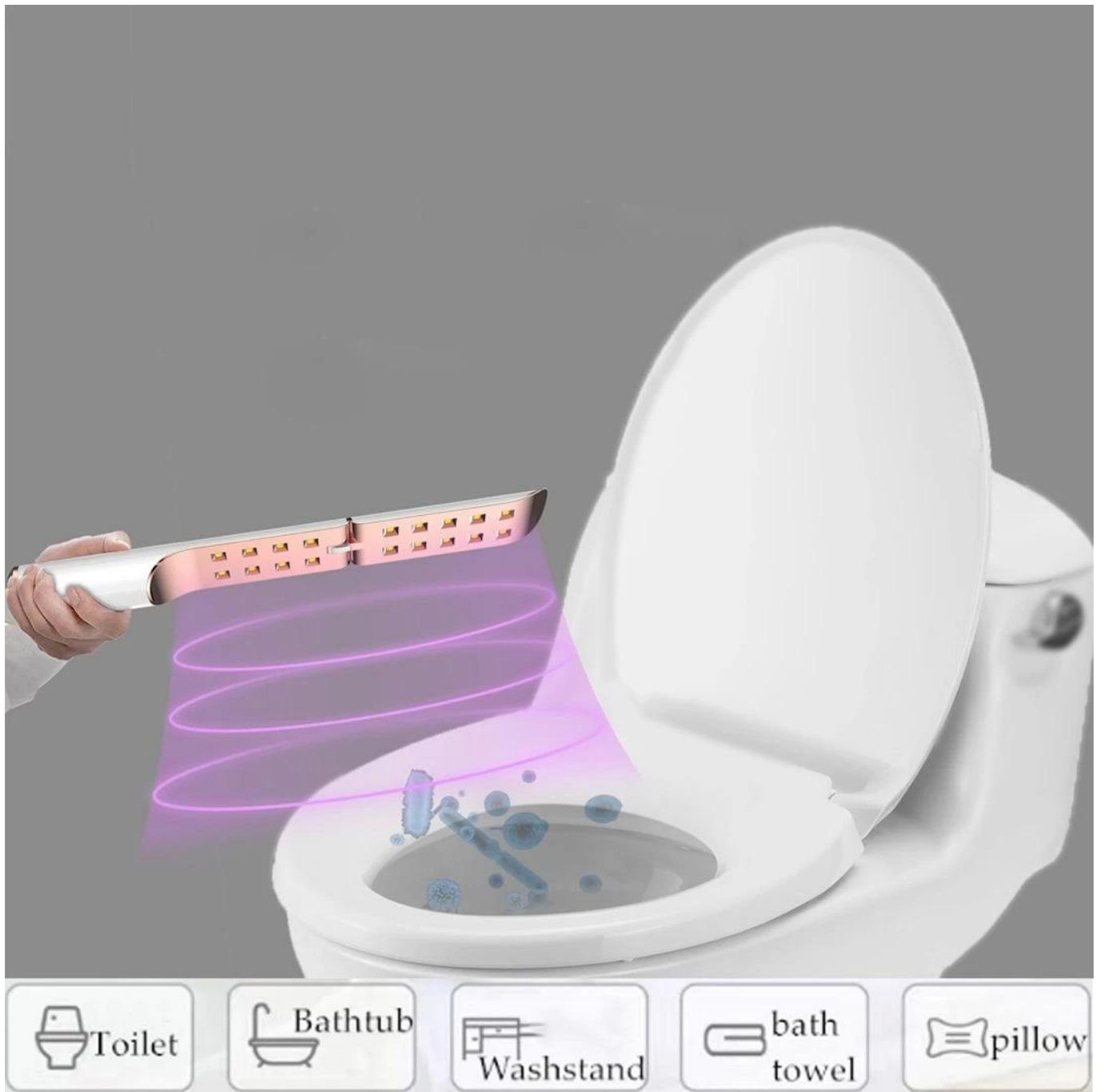
Presentazione del prodotto