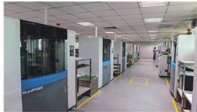
High-speed flying probe machine