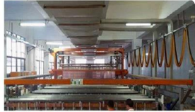
Pattern Plating Machine