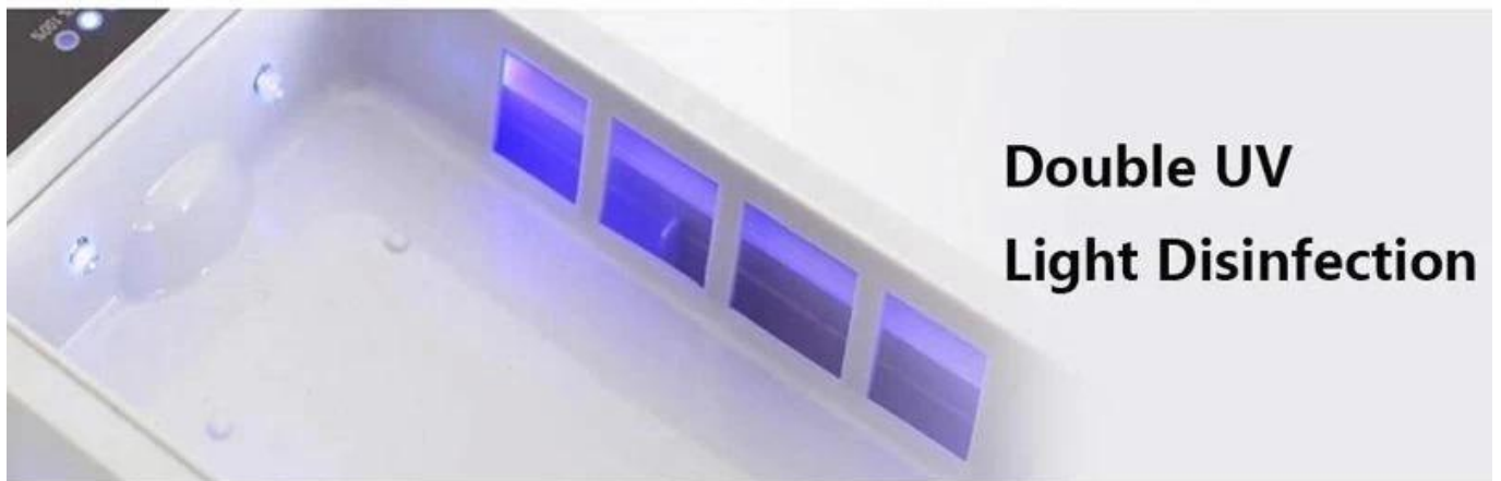
Double UV Light Disinfection