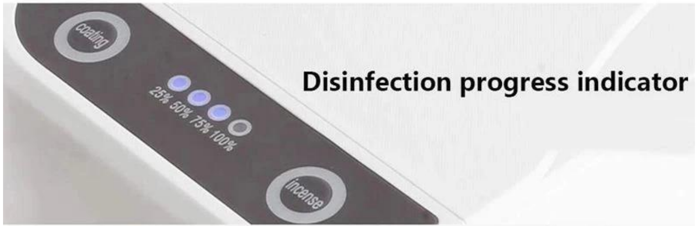
Disinfection progress indicator