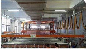
Pattern Plating Machine