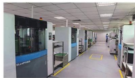
High-speed flying probe machine