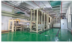
Automatic vacuum press machine