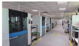
High-speed flying probe machine