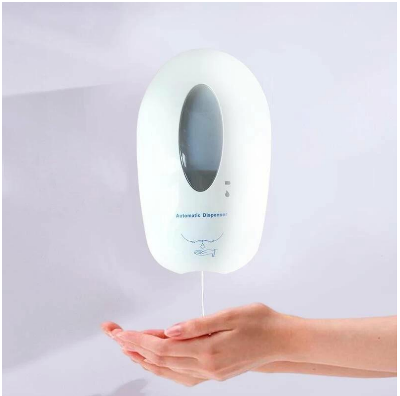
Dispensador de jabón de espuma con soporte sin contacto