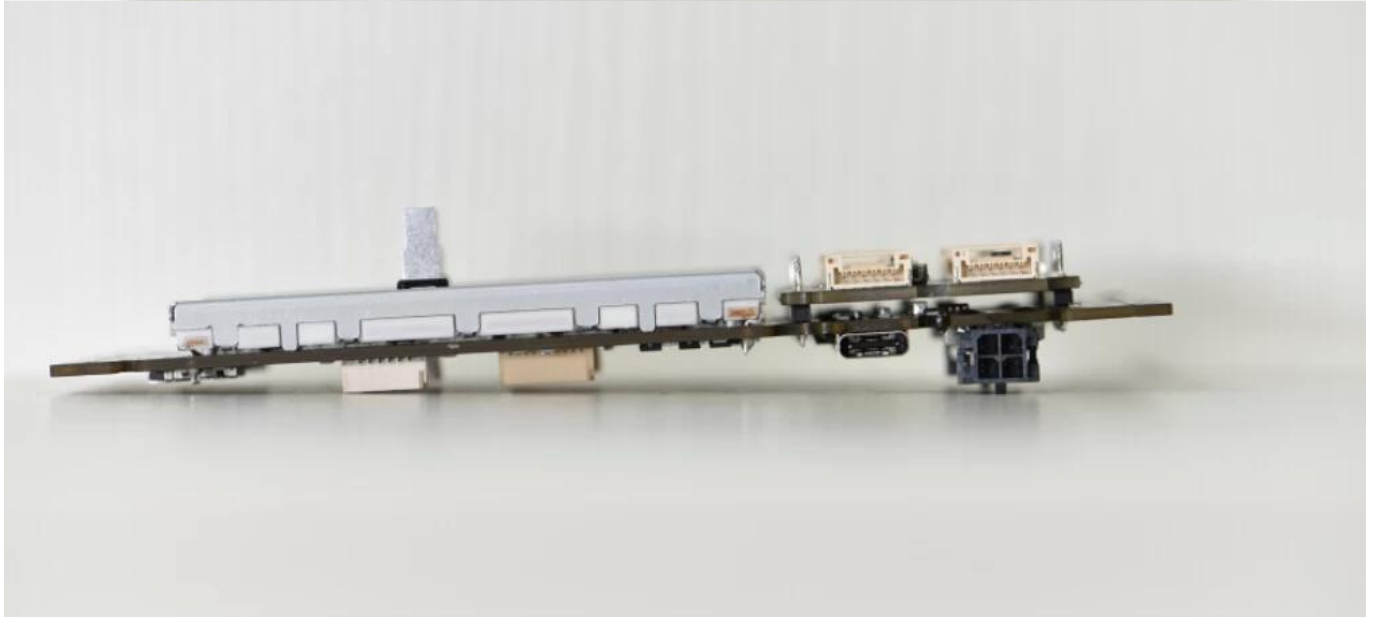
Empresa de placas de circuito impreso, fabricante de pcb de alta calidad