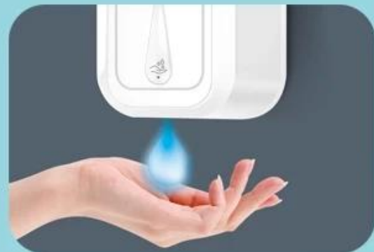
Smart hand sanitizer