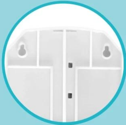
Four grooves can be hung on the wall