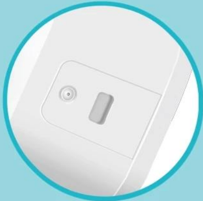
Automatic liquid sensing, position sensing

Sensing distance 5cm, rapid liquid discharge in 0.25 seconds