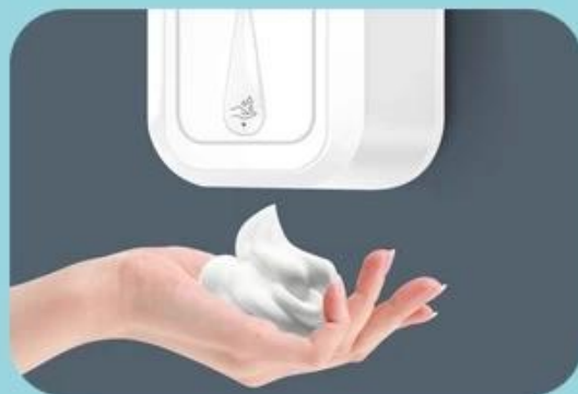
Smart out of bubble