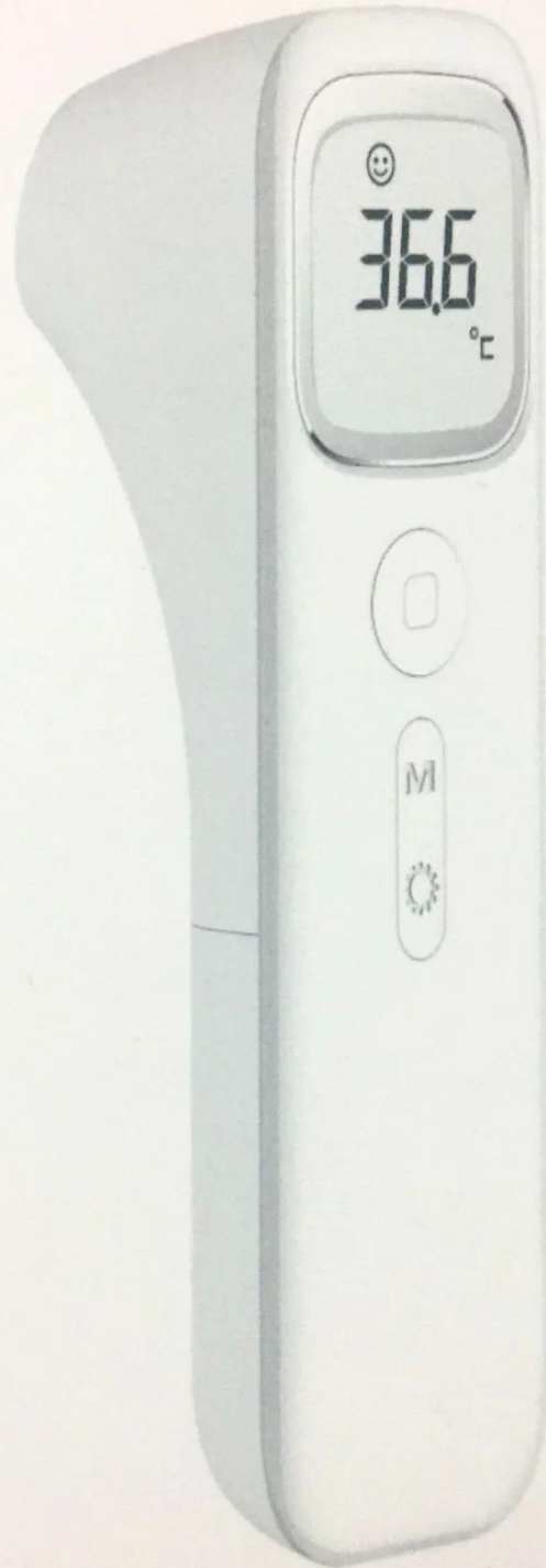
DY-A200 INFRARED THERMOMETER