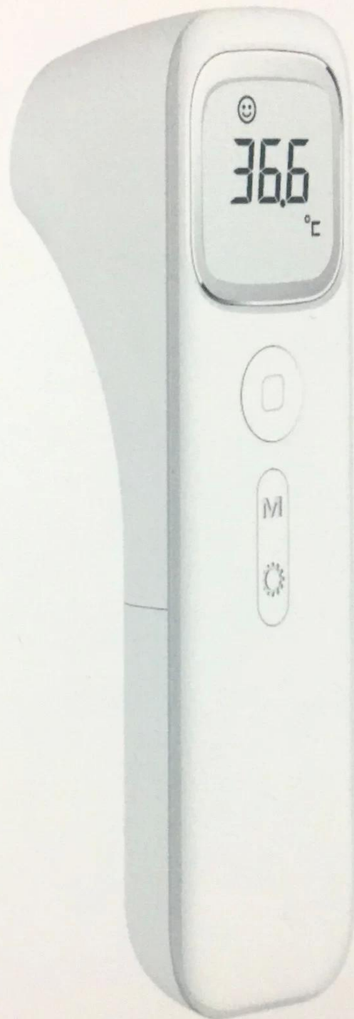
DY-A200 INFRARED THERMOMETER