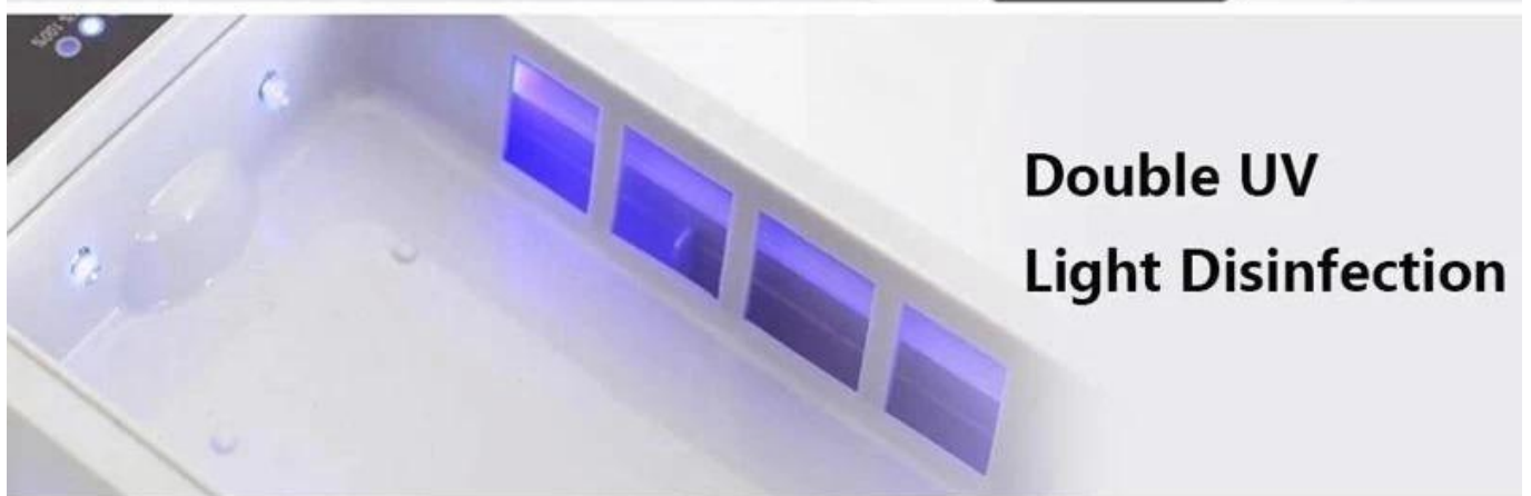
Double UV Light Disinfection