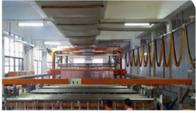
Pattern Plating Machine